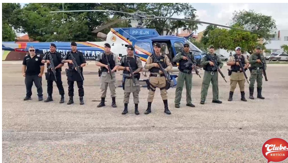
Figura I - Integrantes da Operação Divisa Integrada

Como resultado, a operação obteve seis prisões e apreensão de alguns materiais, tais como: duas armas de fogo; três munições calibre.22; alguns tablets e porções de maconha; uma porção de crack; seis telefones celulares; um rádio HT; uma motosserra; R$161,00; redes, tarrafas e outros materiais ilícitos.