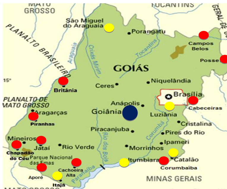
Figura 1: Bases do COD no Estado de Goiás

Inicialmente, desde a sua efetivação, foram instaladas três Bases Operacionais, nos municípios de Cachoeira Alta, Aporé e Chapadão do Céu devido a necessidade operacional na região, tendo sido posteriormente, ativadas outras oito Bases Operacionais, sendo que, estão previstas a instalação de outras cinco em regiões diversas do Estado.