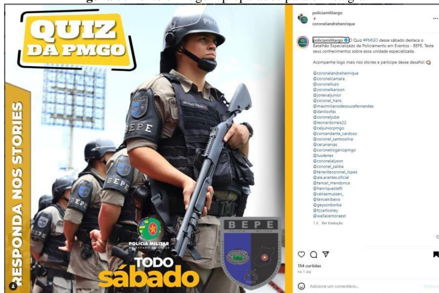
Figura 5: Texto e imagem preparados para o Instagram