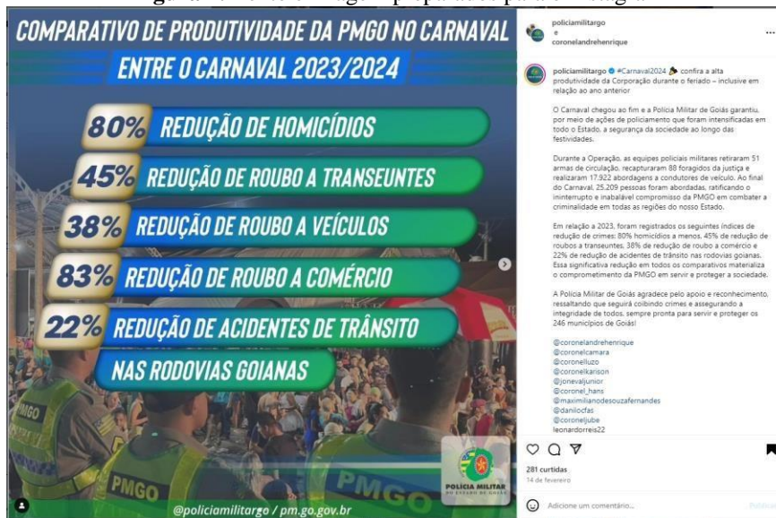
Figura 4: Texto e imagem preparados para o Instagram