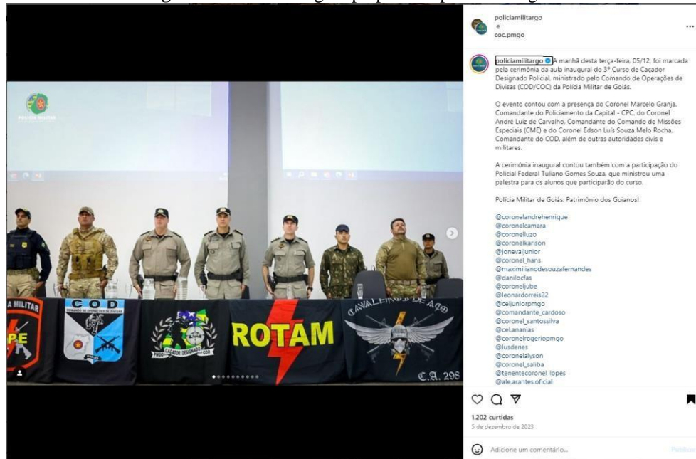
Figura 2: Texto e imagem preparados para o Instagram