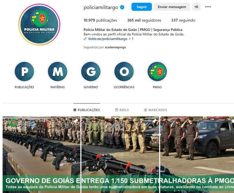
Figura 1: Imagem do Perfil da Polícia Militar do Estado de Goiás.