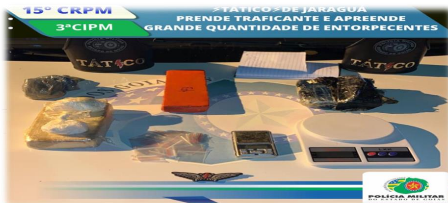
Figura 3 – Tático de Jaraguá – apreensão de entorpecentes

Segundo o histórico da unidade, a produtividade do trabalho para combater o tráfico de drogas, no período compreendido de junho de 2020 até junho de 2021, foi de 82 kg de drogas apreendidas na região (Figura 3):