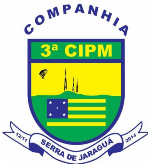
Figura II – Brasão da 3ª CIPM