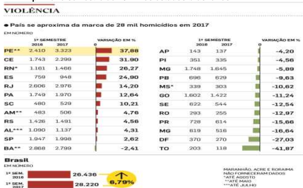
Figura 1 – O comparativo do aumento da violência entre o primeiro semestre de 2016 e o primeiro semestre de 2017 nos estados brasileiros

Há um descaso em relação a estes fatores, e principalmente na segurança pública. O índice de criminalidade vem crescendo cada vez mais, assim como mostra a figura fornecida pelo infográfico/estadão, tornando-se quase incontrolável.