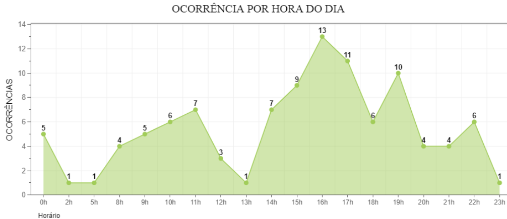
Figura 3: Ocorrência por hora do dia