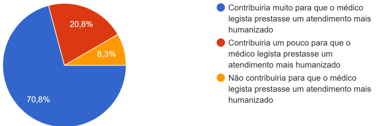
Gráfico 2 – Contribuições do envio de relatório prévio da delegacia