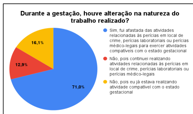
Gráfico 1. Resultado da pergunta referente à ocorrência de alteração na natureza do trabalho realizado durante a gestação.