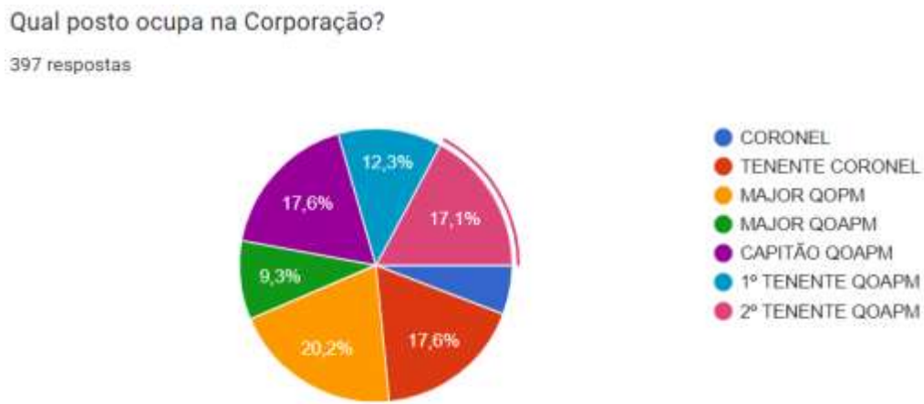
Figura 2 - Posto ocupado pelos respondentes