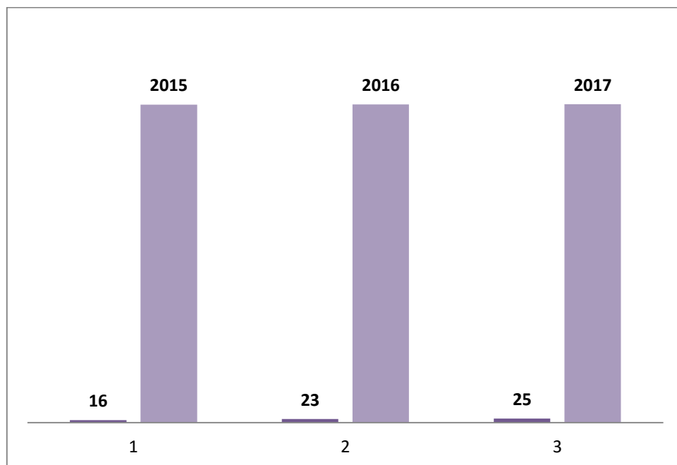
Gráfico 02 - Denúncias

Evidente que o policial militar conta limitações de acordo com a doutrina, e esse questionamento veio à tona no momento propício onde se buscou verificar quantas denúncias sobre o uso da força policial envolvendo menores, a Corregedoria obteve do ano de 2015 a 2017 na região Metropolitana de Goiânia.