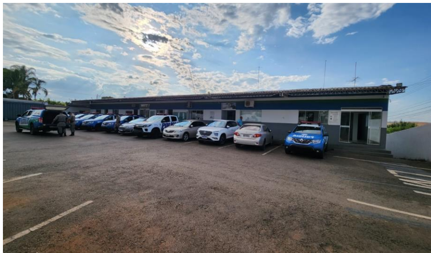
Figura 7: Pátio e estacionamento atual da unidade (2023)