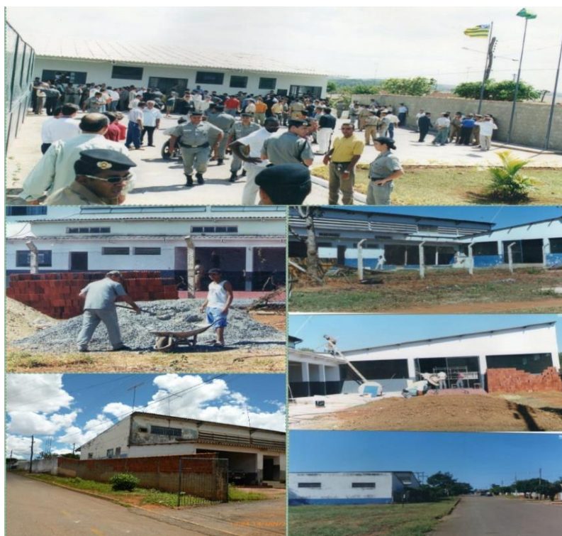
Figura 5: 24ª CIA Independente – Reformas (2002)

No momento da criação do 28º batalhão, devido à demanda por um maior policiamento na área norte da cidade, as viaturas disponíveis naquela época, por volta de 2010, eram limitadas (Entrevistado 2). O armamento utilizado naquela época era principalmente a pistola calibre .40. Posteriormente, com a chegada do Major Camara e do Major Luciano, hoje ambos com a patente de Coronel, houve notáveis melhorias nas instalações do batalhão, incluindo a criação de salas de aula, aprimoramentos no pátio e no aspecto da estrutura administrativa (Entrevistado 2).