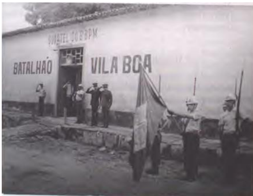
Figura 1: 6º BPM – Batalhão Vila Boa (1963)

Inicialmente, a Força Policial Goiana tinha que conviver com o 20º Batalhão do Exército e Esquadrão de Cavalaria. Diante disso, fazia-se necessário a criação de uma sede para a recém-criada Força Policial (SOUZA, 1999, p. 36). Em Junho de 1863, a Fazenda Provincial adquiriu um terreno de 724 metros quadrados dos herdeiros do falecido Coronel João Nunes da Silva. Essa área foi destinada à construção do primeiro Quartel da Força Policial de Goyaz, que serviu como quartel-general da Corporação de 1863 a 1936. Atualmente, o local abriga a sede do 6º Batalhão da Polícia Militar na cidade de Goiás (SOUZA, 1999, p. 36).