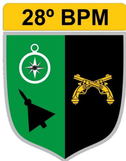
Figura 3: Brasão da Unidade (2023)

como nos distritos de Interlândia, Souzaânia e Goialândia.