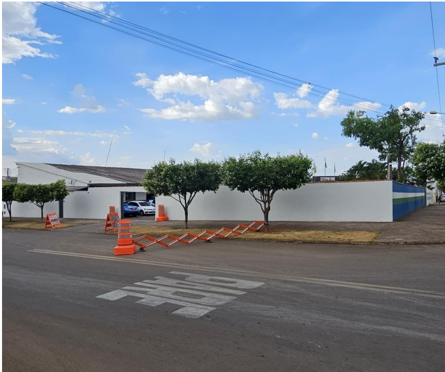
Figura 6: Fachada atual da unidade (2023)

O 28º Batalhão tem como missão assegurar a tranquilidade social e a manutenção da ordem pública em sua área de atuação, por meio de atividades de policiamento ostensivo e preventivo de acordo com a legislação vigente. A unidade se orienta pela abordagem do policiamento comunitário, tendo como objetivo a construção de uma segurança pública eficaz e colaborativa, onde a comunidade é vista como parte integrante desse processo. Seus princípios fundamentais incluem o profissionalismo, a confiabilidade, a disciplina, a integridade e o respeito, com a constante busca pelo respeito aos direitos e pela promoção da legalidade.