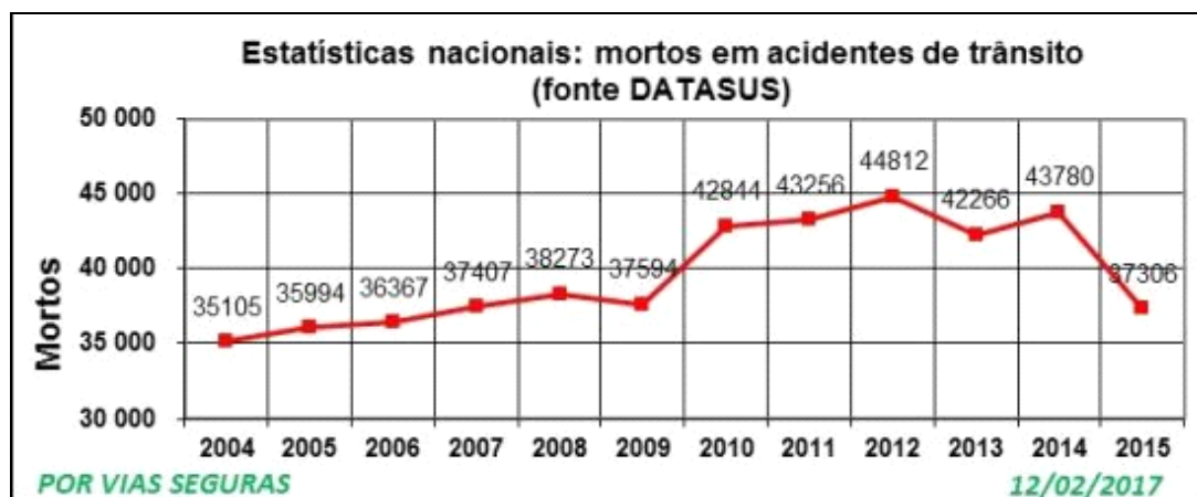
Gráfico 1 – Estatísticas nacionais: mortos em acidentes de trânsito

Para melhor compreensão dos índices no país, abaixo tem-se os seguintes gráficos: