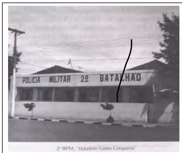
Figura 02 – Foto Histórica do 2º Batalhão de Polícia Militar em Rio Verde – Batalhão Gama Cerqueira

Fonte: Site Polícia Militar Acesso em: 21/11/2023