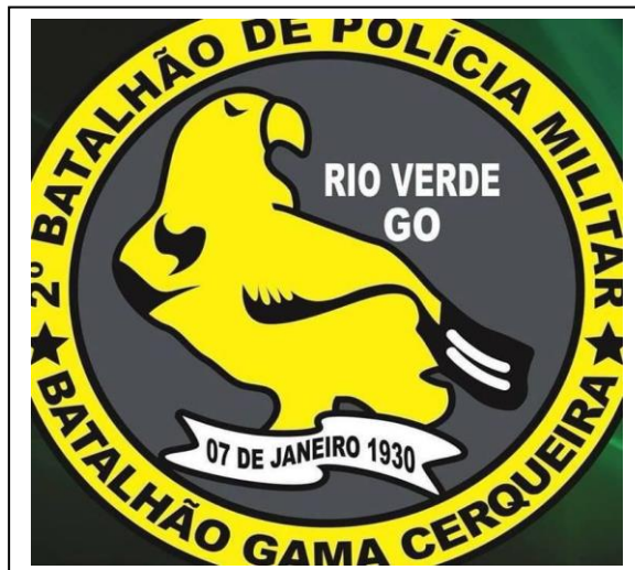
Figura 1 – Brasão do 2º Batalhão de Polícia Militar em Rio Verde – Batalhão Gama Cerqueira

Fonte: Site Polícia Militar Acesso em: 21/11/2023