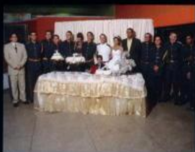
Cúpula de Aço - Cad Polidório