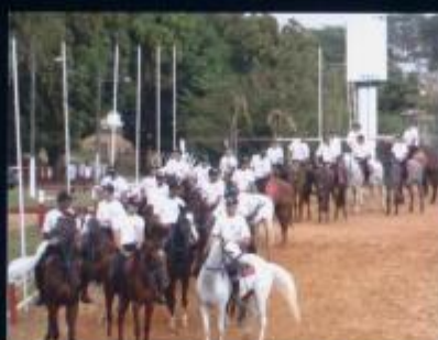
Aula na Cavalaria