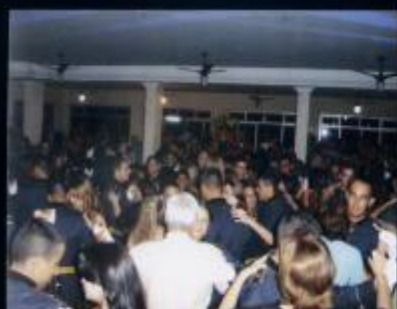
Baile do espadim