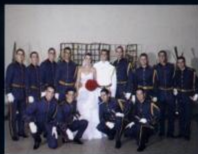
Cúpula de Aço - Cad Renner