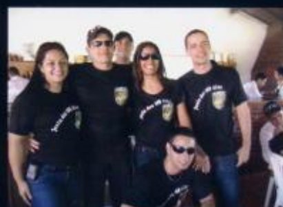
Cmt do CFO e Comissão de Formatura