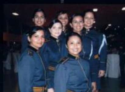
148º Aniversário da PM