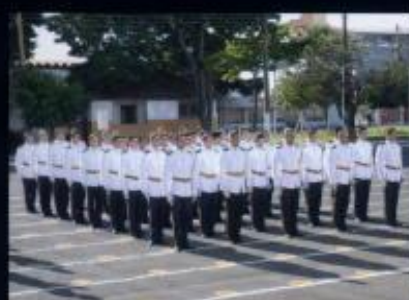
Preparativos para Formatura