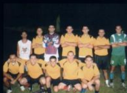
Time de Futebol do CFO