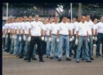
Iniciação no Militarismo