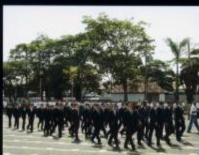
Apresentação no CFO