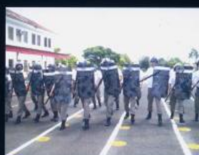
Aula de Operações de Choque