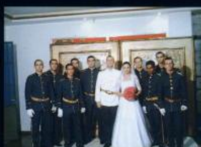
Cúpula de Aço - Cad Rabelo