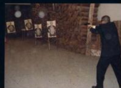
Aula prática de Proteção de Autoridades