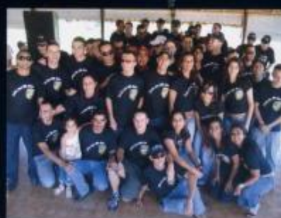
Festa dos 100 dias