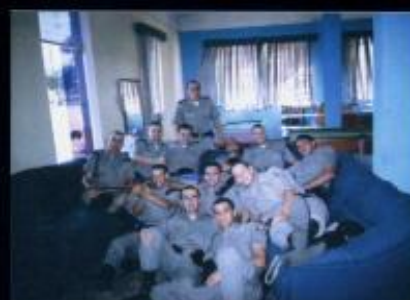
Lazer no Cassino