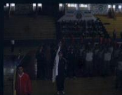
Jogos Acadêmicos em Brasília