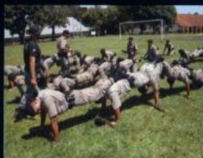
Aula de Operações Especiais