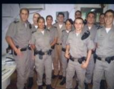
Estágio do 1º Ano