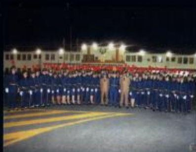
Solenidade de entrega do Espadim