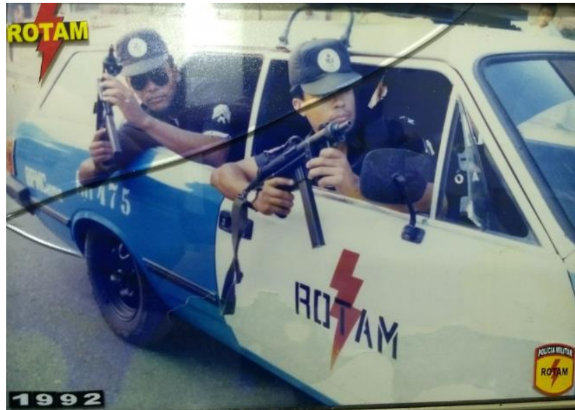
Figura 02 – Armamento e patrulhamento