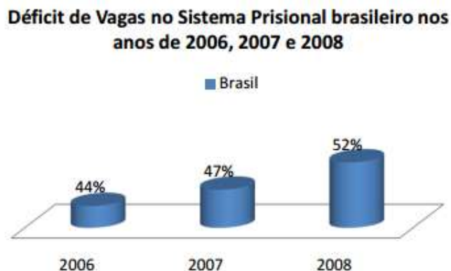
Figura 1 – Déficit de vagas no sistema prisional Brasileiro.

Segundo o autor acima, devido grande demanda de detentos vários foram os estabelecimentos de detenção criados, no entanto, não sabe se pelas condições sub-humanas que vivem os presos brasileiros, se foi o risco de rebelião, no entanto o déficit de vagas no sistema prisional é, ainda, uma realidade, constante o que é possível ver no gráfico abaixo.