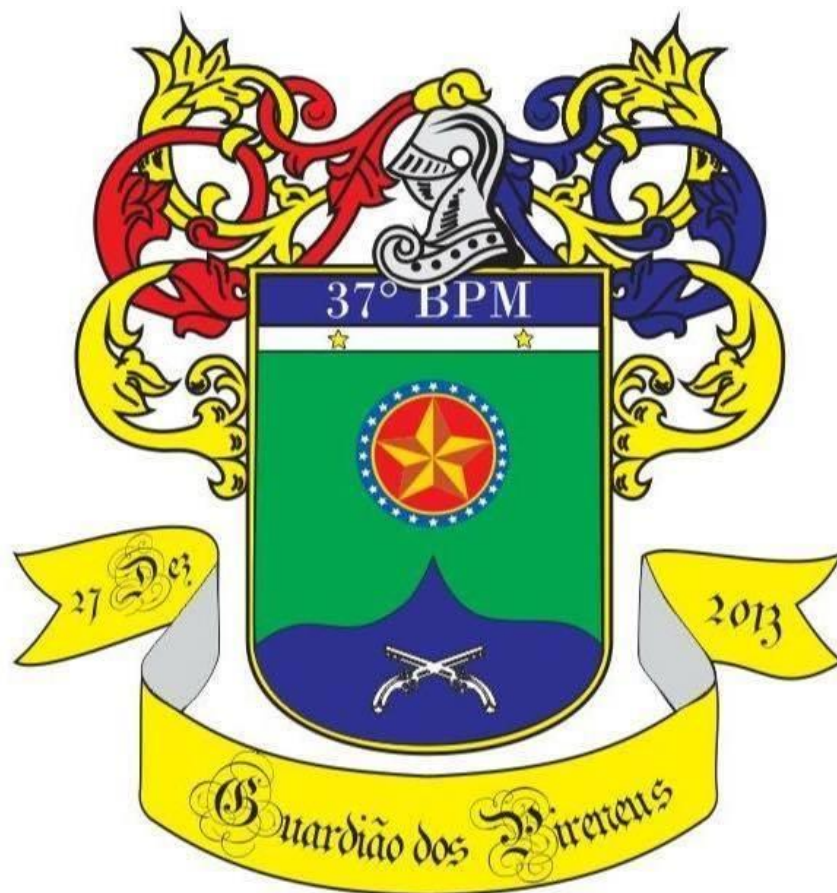
Figura 1 – Brasão do 37ºBPM