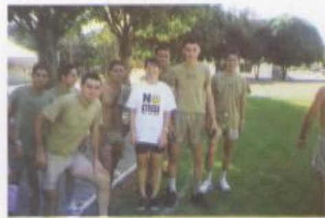
Prática de Educação Física