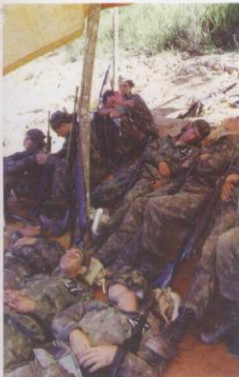
Momento de descanso do curso de Ações Táticas em Ambientes Rurais