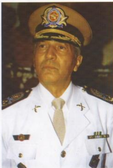
• Cel QOPM Paulo Alves Vieira é Comandante Geral da Polícia Militar do Estado de Goiás

Nos dias atuais, vivenciamos um progresso muito rápido nos mais diversos campos sociais e, infelizmente, numa projeção ainda maior, cresce a criminalidade