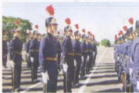
Solenidade de entrega do Espadim