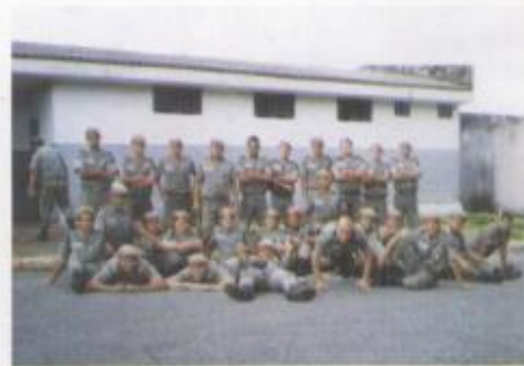
Primeira instrução ao curso