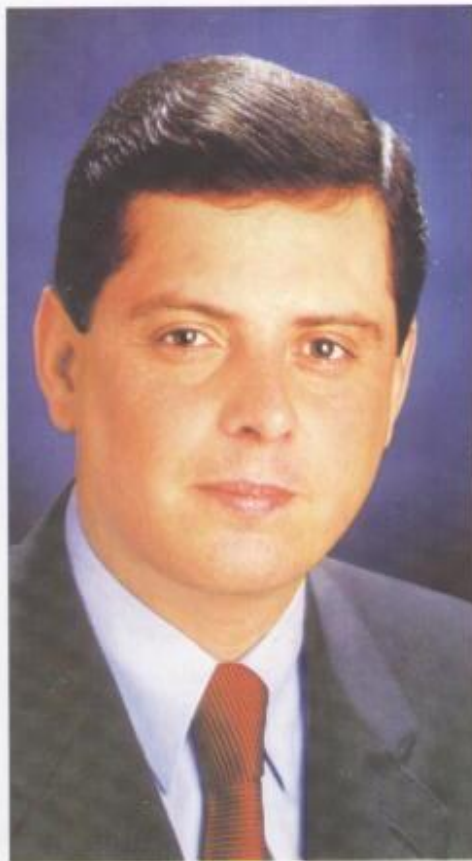
• Marconi Ferreira Perillo Júnior é Governador do Estado de Goiás.