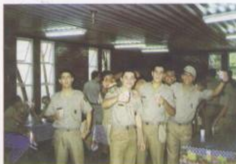
Confraternização da turma no rancho