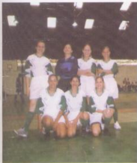
1ª equipe de futebol de salão feminina da APM-GO