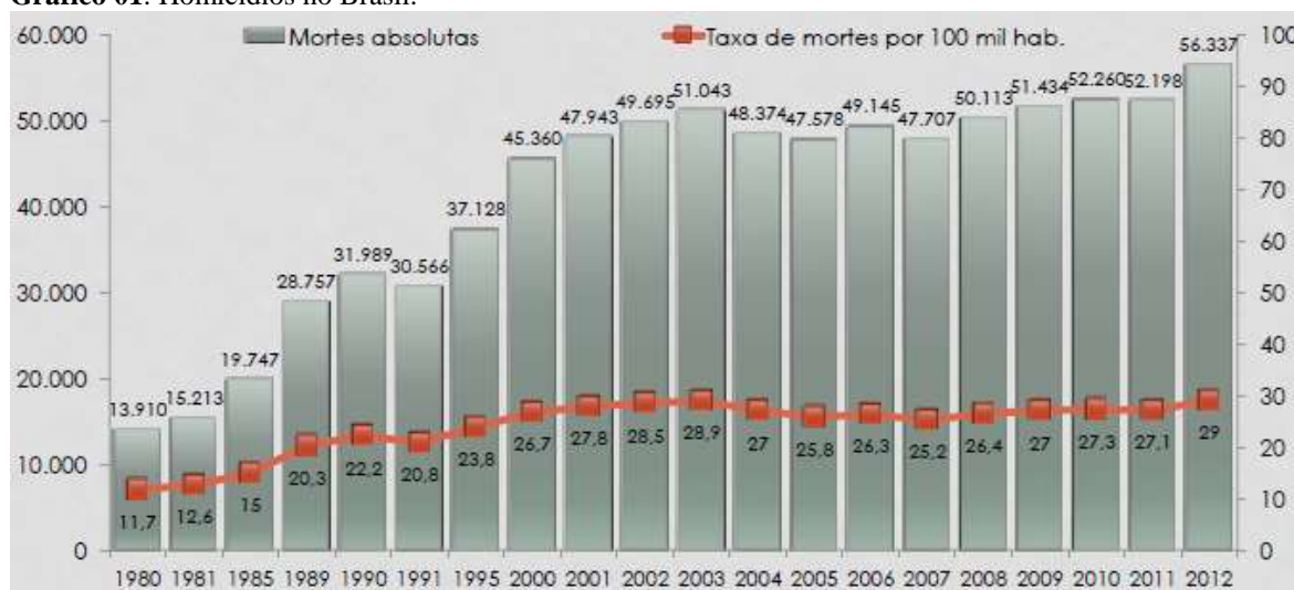
Gráfico 01. Homicídios no Brasil.

O gráfico abaixo expõe a taxa de homicídios no Brasil por cada 100 mil habitantes e, conforme se constata o número é alarmante: