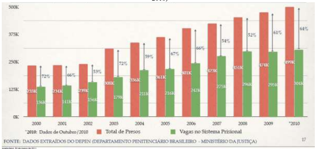
Gráfico 1: Sistema Penitenciário brasileiro: Evolução da população carcerária x vagas no sistema prisional (2000 – 2010)

Para Machado et al (2013) a população carcerária brasileira cresce, constantemente, o que apenas fortalece os vários problemas existentes dentro dos presídios brasileiros. No gráfico 1 é possível observar os dados que refletem essa questão, pois no ano 200 já havia uma defasagem do número de vagas em relação ao número de pessoas presas e essa situação apenas piorou, como pode-se notar nos dados do ano de 2010: