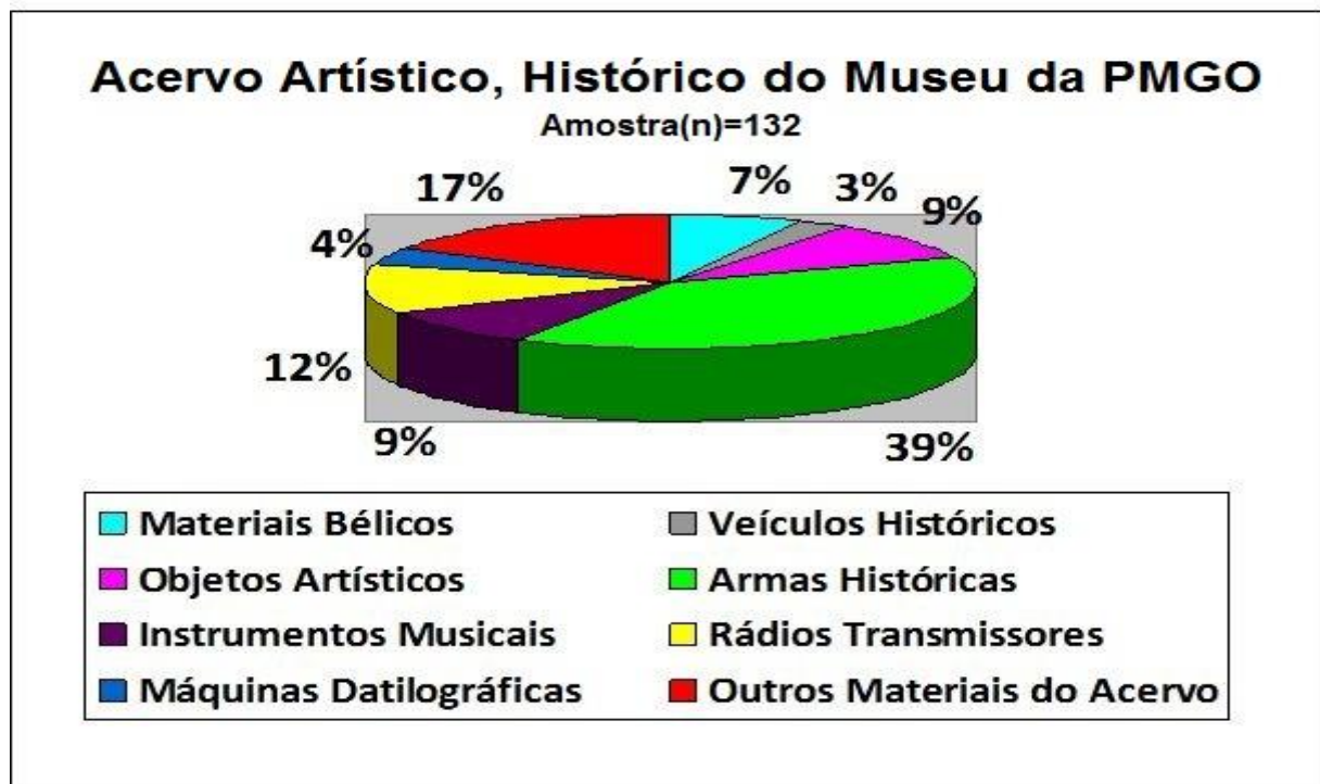
Gráfico 01 – O Acervo Museológico