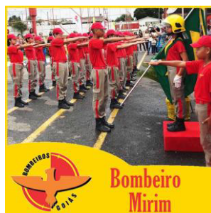
Figura 1 – Bombeiro Mirim na cidade de Caldas Novas

Dentro dessa perspectiva o Corpo de Bombeiros Militar, órgão integrante da Secretaria de Segurança Pública e Justiça, por meio de sua competência de papel educacional, iniciou, em 1997, na cidade de Caldas Novas, um projeto voltado para o público infanto-juvenil (Goiás, 2020), denominado Projeto Educacional Bombeiro Mirim (Leite, 2014).