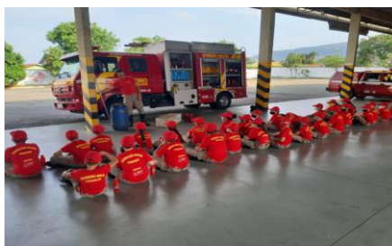
Figura 2 – Programa Bombeiro Mirim em Jaraguá

Foram 50 (cinquenta) cidades que realizaram o bombeiro mirim no último ano, com 1.534 (mil quinhentos e trinta e quatro) alunos formados (BM/8, 2024).