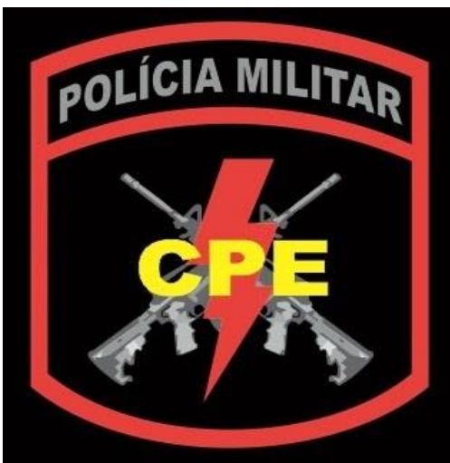
Imagem Do Brasão