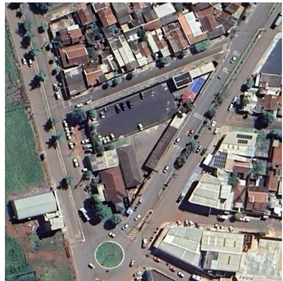
Imagem 4 – Imagem de Satélite.