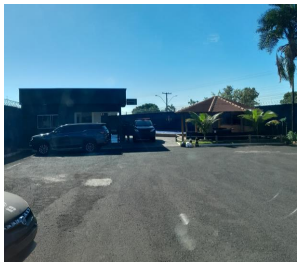
Imagem 6 - Espaço Rafael Matheus.