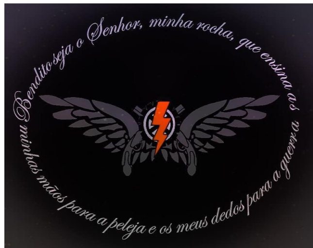
Imagem Do Brevê