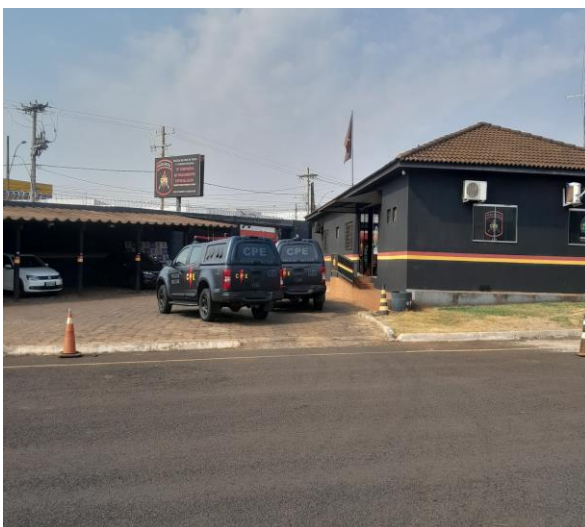
Imagem 5 – Sessão administrativa.