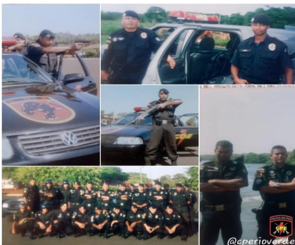
Figura 1 – Fotos históricas