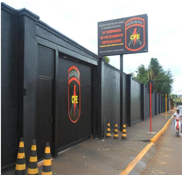
Imagem 3 – Portão de entrada.

Estes guerreiros abatidos em combate, cumpriram com seus deveres de preservar a ordem pública , “mesmo com o risco da própria vida” e para sempre serão lembrados pela CPE de Rio Verde.