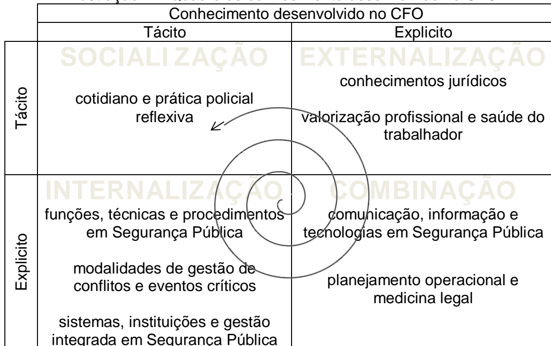
Ilustração 7 – Quadro do conhecimento desenvolvido no CFO

Fonte: (O autor adaptado de Nonaka e Takeuchi, 1997, p. 67)