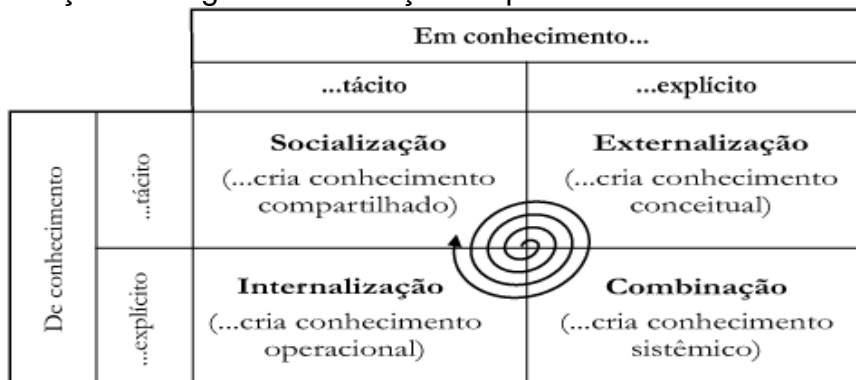
Ilustração 4 – Figura da Interação do processo de conhecimento:

A gestão do conhecimento tem como pioneiros Nonaka e Takeuchi (1997). Estes autores afirmam que, o processo de construção do conhecimento diz respeito a crenças e compromissos e está relacionado à ação, à atitude e a uma intenção específica. Segundo os autores o “conhecimento humano é criado e expandido através da interação social entre conhecimento tácito e o conhecimento explícito” (Nonaka e Takeuchi, 1997, p.67). Essa interação, afirmam os dois, acontece mediante quatro processos de conhecimento: socialização (conhecimento compartilhado), externalização (conhecimento conceitual), combinação (conhecimento sistêmico) e internalização (conhecimento operacional). A referida interação pode ser visualizada na figura a seguir: