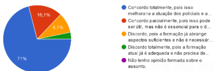
Gráfico 3 – Formação educacional militar e direitos humanos e ética

Segundo o gráfico 3 em relação a concordância se a formação inicial dos policiais militares deve abordar de forma mais abrangente os temas de direitos humanos e ética as respostas dos entrevistados destacaram que 22 (71%) concordaram que isso melhoraria a atuação dos policias.