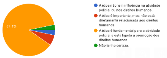
Gráfico 2- Ética e polícia

Também foi questionado qual o papel da ética na atividade policial e sua relação com a promoção dos direitos humanos, de acordo com o gráfico 2 abaixo