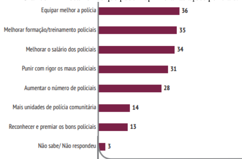
Gráfico 1 – Mecanismos que podem aprimorar as ações policiais.