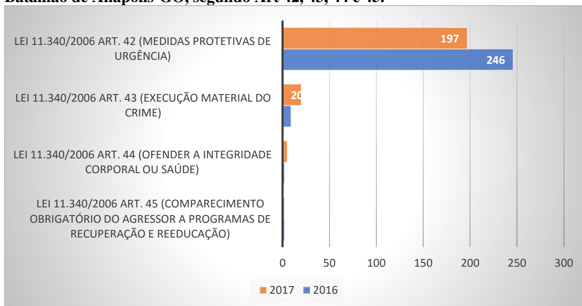
Gráfico 3: Ocorrências da Lei Maria da Penha nos anos de 2016 e 2017 na área do 4º Batalhão de Anápolis-GO, segundo Art 42, 43, 44 e 45.