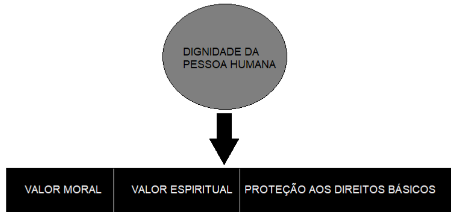
Figura 2 - Da dignidade da Pessoa Humana