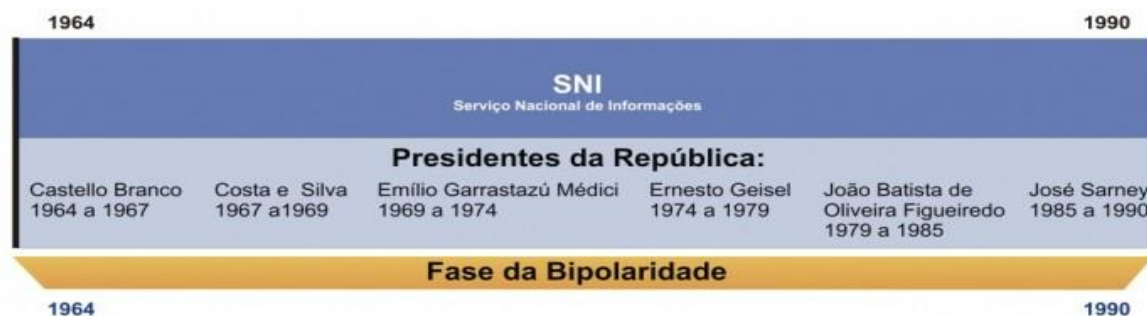
Fotografia 2 – Linha do Tempo Fase da Bipolaridade

A Atividade de Inteligência é marcada na referida fase, pela criação do Serviço Nacional de Informações (SNI), que serviu para subsidiar as ações governamentais durante todo regime militar, em um contexto turbulento marcado pela Guerra fria e pelos conflitos ideológicos de classes da América Latina.