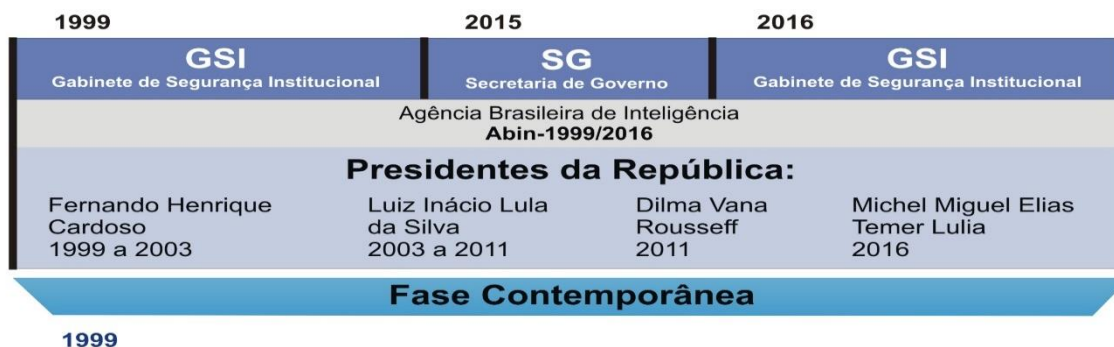
Fotografia 4 – Linha do Tempo Fase Contemporânea