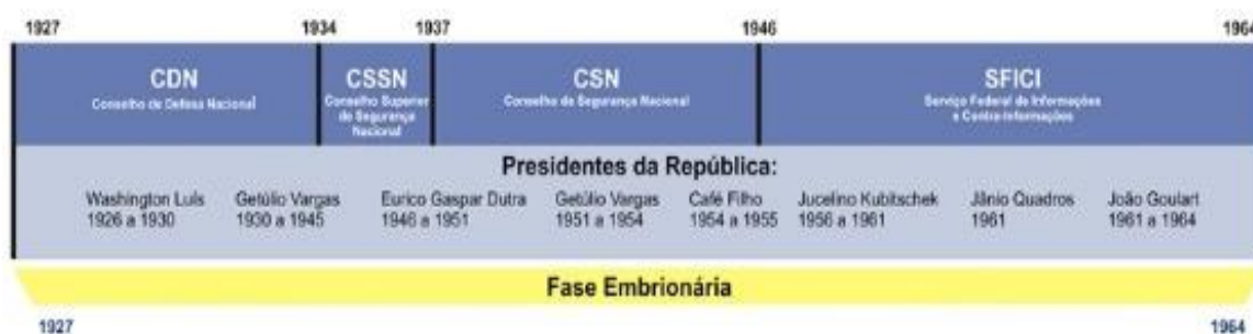
Fotografia 1 – Linha do Tempo Fase Embrionária

Esta fase referiu-se ao alicerce das primeiras estruturas governamentais destinadas a análise de dados e produção de informações. O Conselho de Defesa Nacional (CDN), foi o órgão pioneiro da inteligência Brasileira, criado em um cenário marcado por movimentos revolucionários e crise econômica.