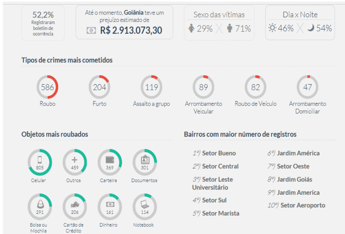
Figura 1: Bairros e criminalidade em Goiânia

Um outro dado retirado do site Onde fui roubado (2018), vai de encontro com a resposta do questionário aplicado, A estatística assusta. São mais de 7 crimes por hora em Goiânia. A cada 8 minutos uma pessoa, estabelecimento ou veículo é roubado na capital de Goiás.