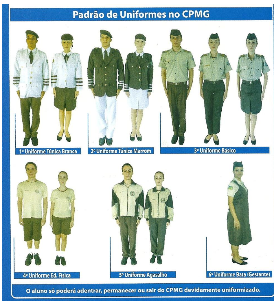
Figura 01: Uniformes adotados no CPMG.

O uniforme é a caracterização da instituição perante a sociedade. A sua utilização favorece a segurança no ambiente escolar, facilitando o controle das pessoas que diariamente não compartilham do convívio escolar. Seu uso pelo corpo discente, faz com que todos se sintam em condições semelhantes quanto à apresentação pessoal, independente das condições financeiras de cada família, por isso a escola zela pelo seu uso correto.