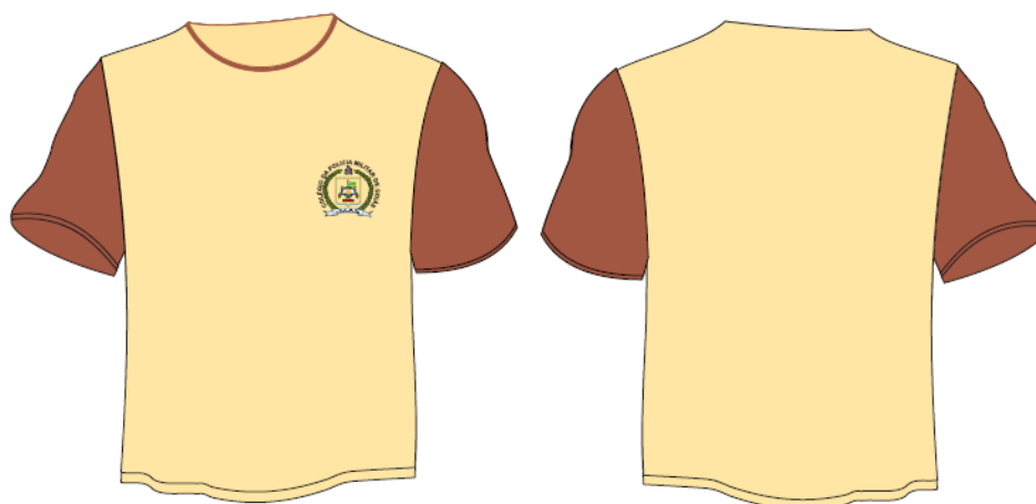
Figura 03: Camiseta cor caqui - mangas marrom café, logotipo colégio Polícia Militar de Goiás - peito lado esquerdo com gola marrom café 1cm largura, malha pv 67% poliéster e 33 % viscose.