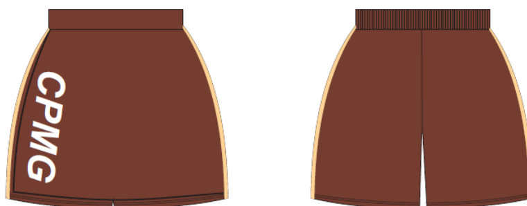
Figura 02: Short-saia com trespasso helanca 100% poliéster, cós parte Frontal elástico 4cm parte de trás, silk CPMG frontal direito com vivos laterais cor caqui, uniforme cor marrom café. Fonte - elaborado pelo autor do artigo.