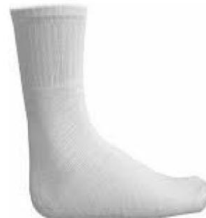
Figura 06: Tênis na cor preta (cadarço Preto). Igual ou Semelhante à Marca All Star. Meia branca 100% algodão.