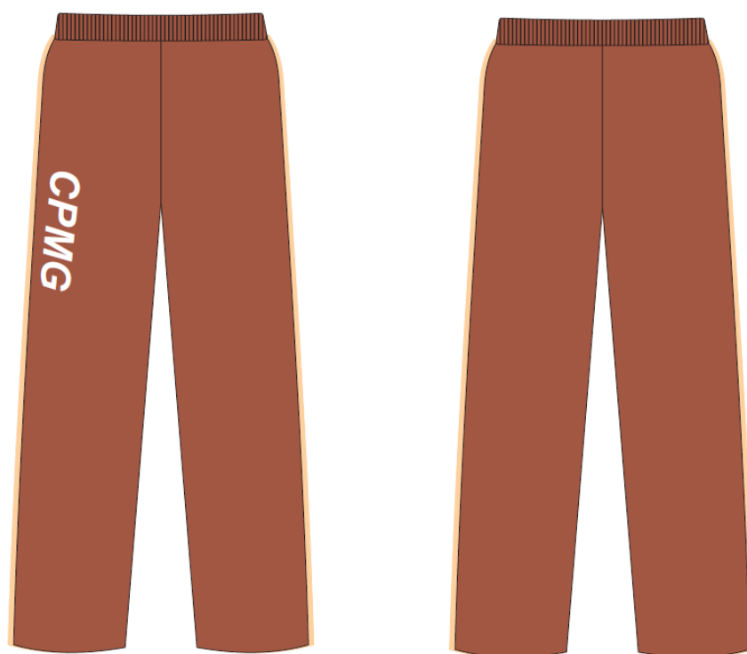
Figura 05: Calça em helanca 100% poliéster, elástico total 4cm, Silk CPMG frontal direito com vivos laterais cor caqui, calça cor marrom café.