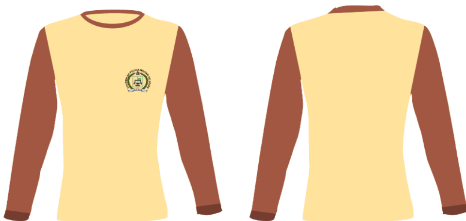
Figura 04: Agasalho cor caqui - mangas marrom café cpm punhos marrom café, logotipo Colégio da Polícia Militar de Goiás - peito lado esquerdo com gola ribana marrom café 2cm largura, tecido moletinho: 100% algodão.