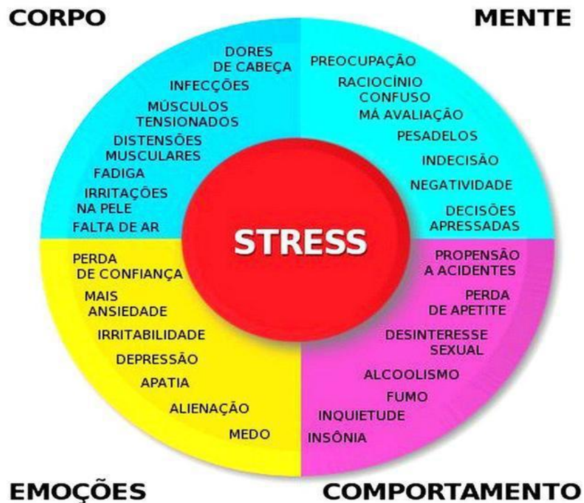
Figura 2- Quadro de Stress