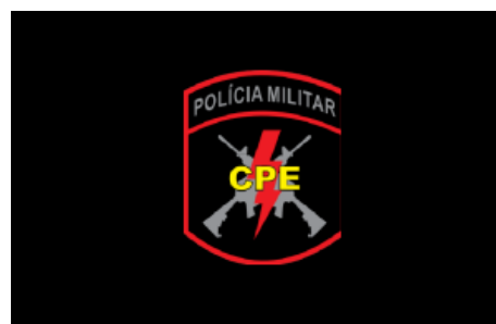
Figura 4- Estandarte CPE