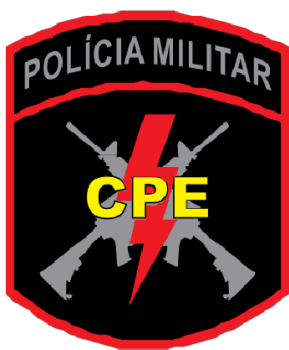
Figura 1- Brasão CPE