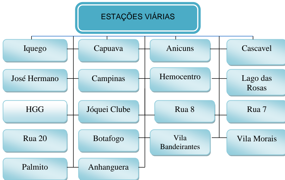
Figura 5 – Estações de ônibus.