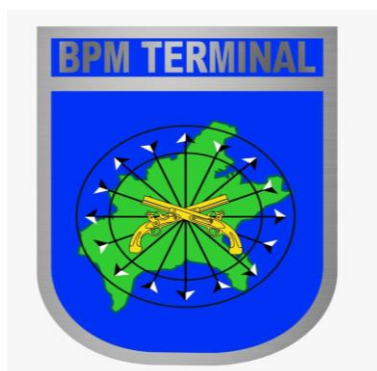
Figura 2 -Brasão do BPM Terminal

Constatou-se que o Batalhão teve algumas sedes ao longo dos anos desde sua criação e inicialmente teve como sede o Comando de Policiamento da Capital – CPC (entrevistado 02). Nesse sentido, constatou-se que devido a pouco espaço e por ter uma estrutura pequena o batalhão sofria com a falta de alojamento bem como outros quesitos que um Quartel precisava ter para o seu devido funcionamento (entrevistado 03).