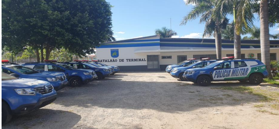
Figura 3 – Vista do Batalhão de Polícia Militar de Terminal

manutenções dos ar-condicionado bem como um campo de futebol, que hoje tem na unidade (entrevistado 03).