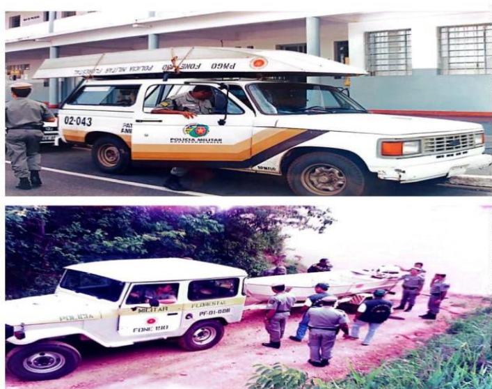
Figura 3: Policiais do BPM Florestal saindo para realizar operações.