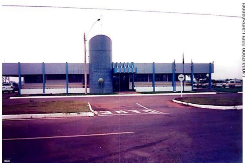
Figura 6: sede do Batalhão Ambiental, em Abadia de Goiás.