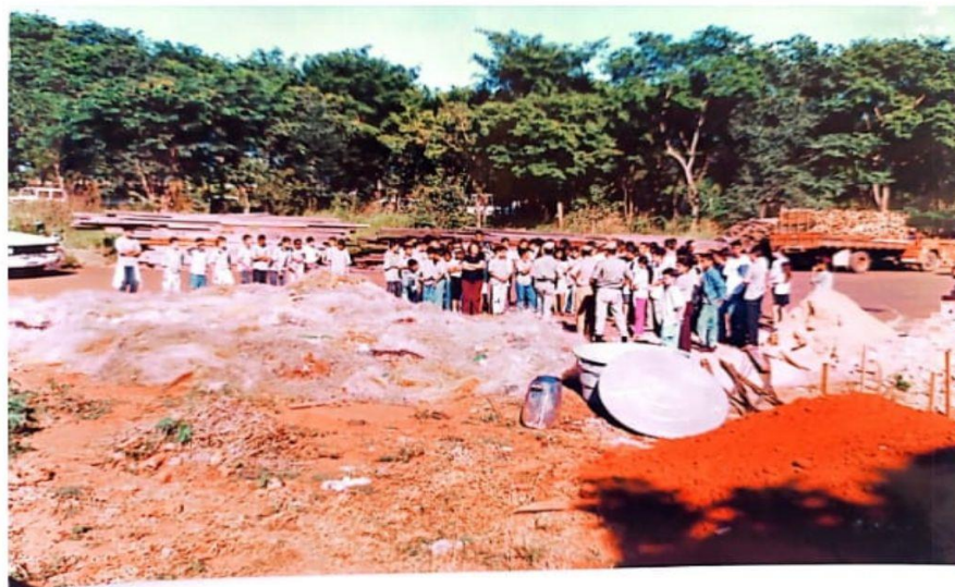
Figura 4: construção do Depósito de Rejeitos Radiológicos em Abadia de Goiás.