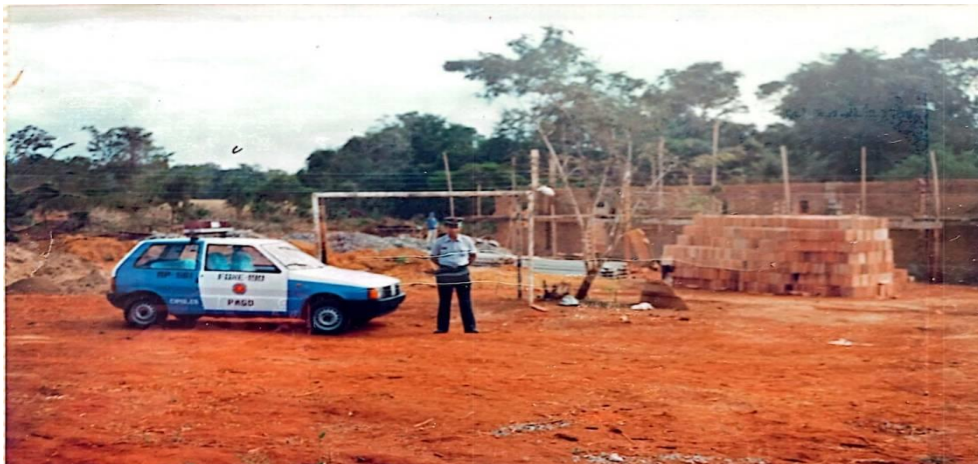
Figura 2: construção das primeiras instalaçõs do Batalhão Florestal