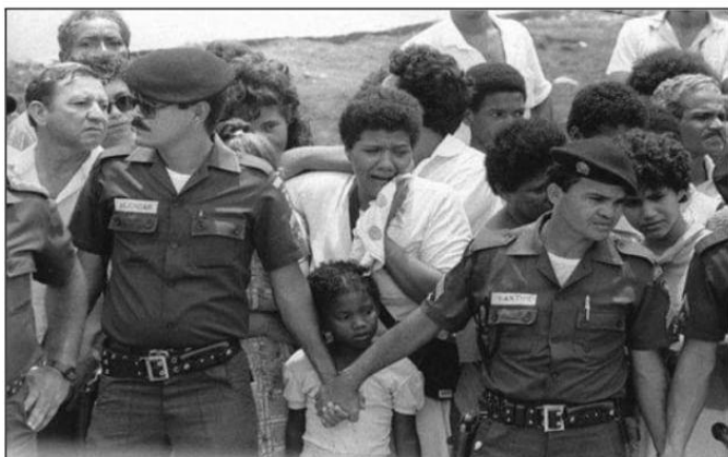
Figura 7: Enterro de algumas vítimas do Acidente Radiológico do Césio 137.