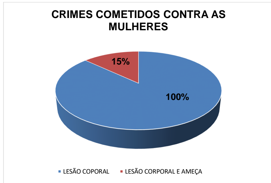
Gráfico 2: Crimes cometidos contra as mulheres