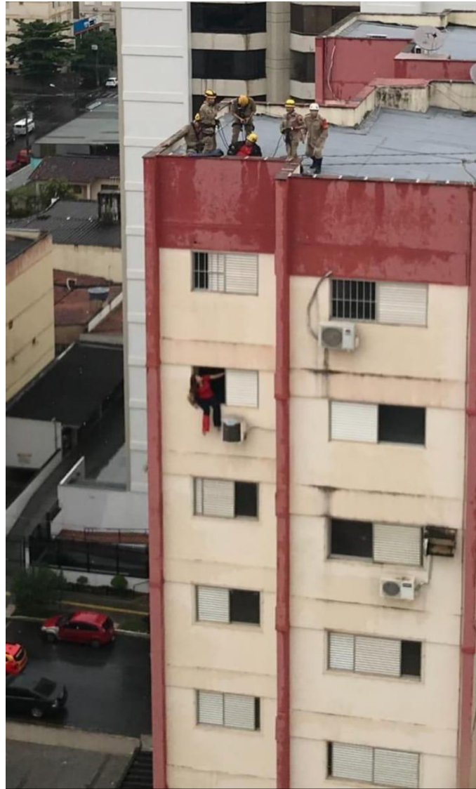
Foto 2 – Salvamento de suicida pelo Corpo de Bombeiros Militar de Goiás