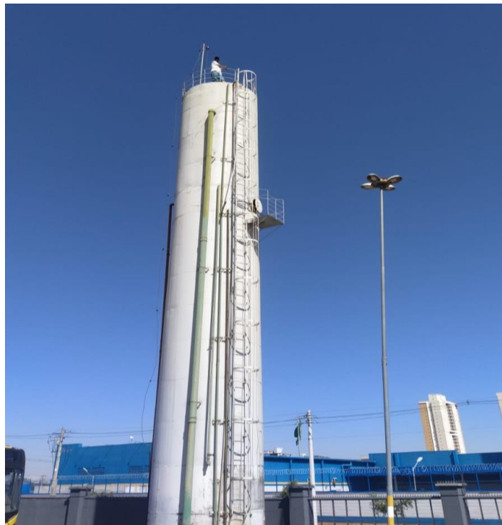
Foto 1 – Suicida em caixa de água do terminal Bandeiras, em Goiânia-GO

Com frequência, policiais militares escalados na função de negociador policial da PMGO são acionados para lidar com situações que não configuram ocorrências policiais. Casos envolvendo ameaças de autoexterminio, com indivíduos que ameaçam se lançar de consideráveis alturas, como prédios, redes de alta tensão ou pontes, sem o envolvimento de armas e sem colocar vidas de terceiros em risco direto, demandam a presença de um negociador, entretanto, destacam a importância de direcionar a intervenção para os profissionais adequados a cada situação, no caso mencionado, o Corpo de Bombeiros Militares, que possuem negociadores com treinamento específico para lidar com essas situações de suicidas em ambiente vertical.