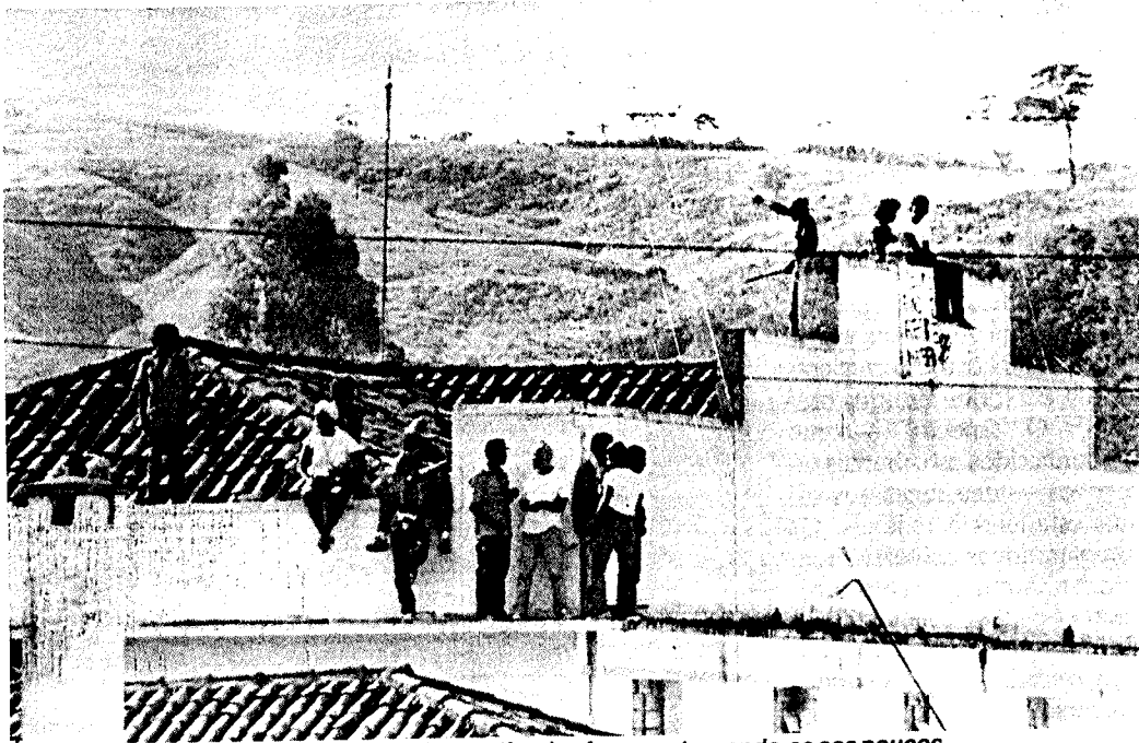
Foram 57 horas de tensão e ameaças. Os amotinados foram entregando-se aos poucos.