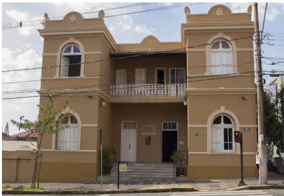
Fachada Principal e Sala Colecionador (Armas)