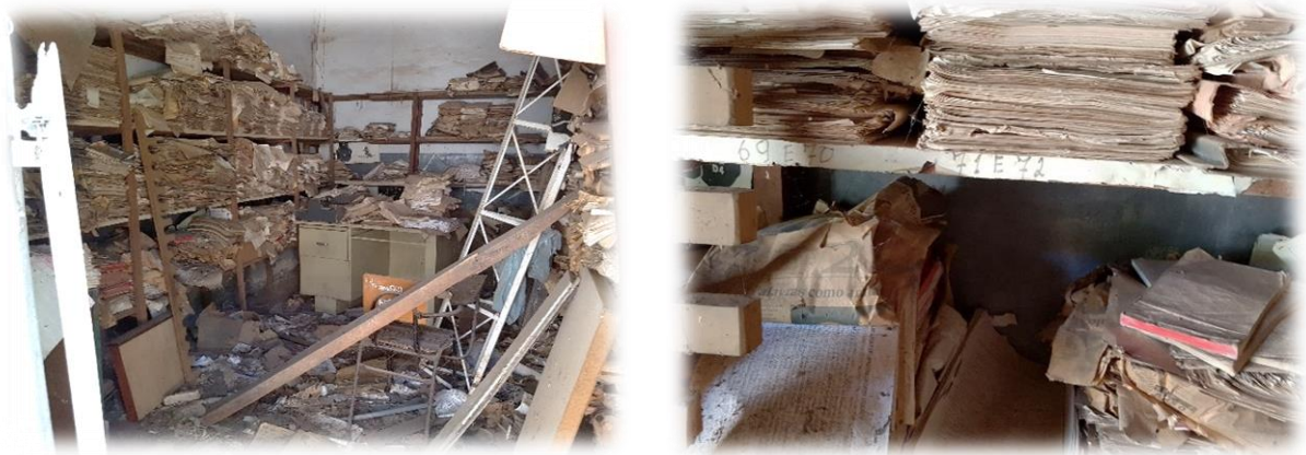
Figura 1 – Documentos do Arquivo morto do 6º BPM

Com a realização deste trabalho foi observado o quanto estão precárias as condições de muitos documentos de posse do 6º Batalhão da Polícia Militar que se encontram de maneira inadequada em uma sala denominada “arquivo morto”. Também nota-se o quanto um profissional da área de museologia seria necessário para atender ao público e para a preservação do mesmo. Grande parte da história do 6º Batalhão, do município, do estado de Goiás e até a nível nacional se encontra jogada de qualquer maneira, sendo destruída pela má conservação. Esses documentos necessitam fazer parte do museu por serem antigos e relatam a vida cotidiana da Polícia Militar em várias décadas passadas, como pode ser observado nas fotos abaixo.