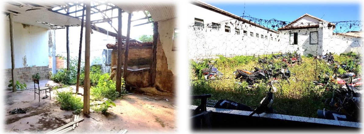
Figura 5 – Parte do prédio em Ruína e pátio com veículos apreendidos

O pátio das instalações está cheio de veículos apreendidos, poluindo visualmente o lugar e até mesmo o próprio solo. Parte da estrutura física está caindo por falta de infraestrutura e manutenção como pode ser observado nas figuras abaixo.