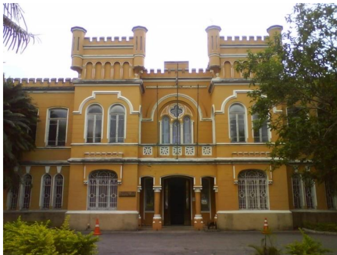
Fachada do museu e motocicleta do acervo.

O Arquivo Histórico do Museu de Polícia Militar é composto por diversos fundos arquivísticas relacionados à história da Polícia Militar e documentos pessoais (cartas, manuscritos, declarações, atestados, certidões, testamentos, etc.) de personalidades militares, totalizando 1.864 metros lineares de documentação. Destacam-se, entre outros, os documentos relativos aos períodos colonial e imperial, os manuais da Missão Francesa na Força Pública e os documentos das revoluções de 1924, 1930 e 1932.