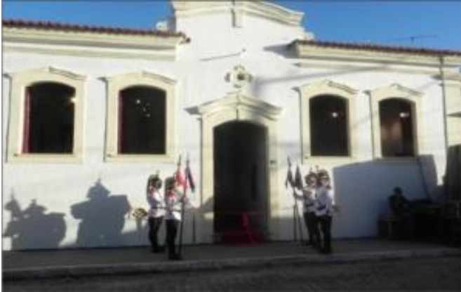
Fachada do museu