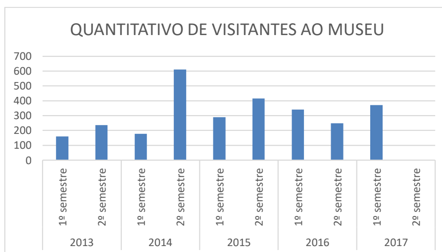
Tabela 01- Quantidade de visitantes do Museu da Polícia Militar de Goiás