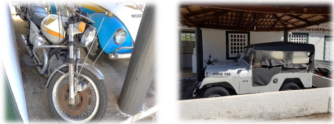
Figura 4 – veículos e garagem