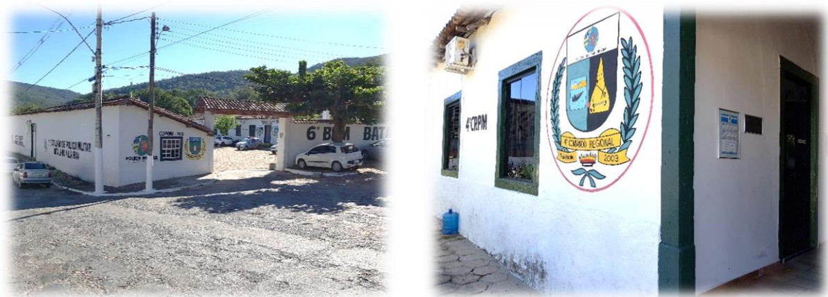
Figura 3 – Prédio do museu da Cidade de Goiás.

O prédio encontra-se no centro histórico tombado pela UNESCO, porém vem sofrendo intervenções ao longo dos anos por comandantes que por falta de conhecimento da necessidade de preservação, fizeram alterações em sua estética física. Entre as alterações feitas indevidamente no prédio, está o uso de blindex em algumas portas e janelas, em seu interior colocaram pisos e divisórias, forro do teto em PVC, o portão de entrada também foi alterado, recebendo uma cobertura que em sua construção original não existia. Uma das grandes perdas que o prédio sofreu, foi a retirada de quatro mangueiras centenárias que existiam no pátio, elas foram cortadas por volta de quatro anos atrás, sem que se tenha pensado em preservação ambiental e muito menos em assegurar a história daquele ambiente.