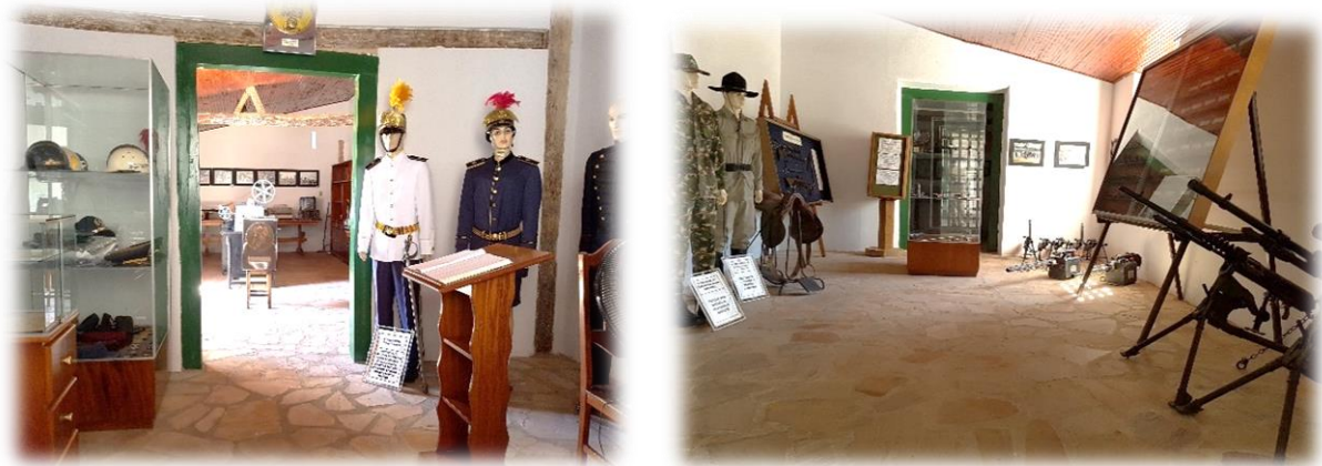
Figura 2 - Museu da Cidade de Goiás

Verificou se a necessidade de repensar a estrutura física do prédio por inteiro, pois como já foi citado acima, o museu se resume a quatro salas inapropriadas.