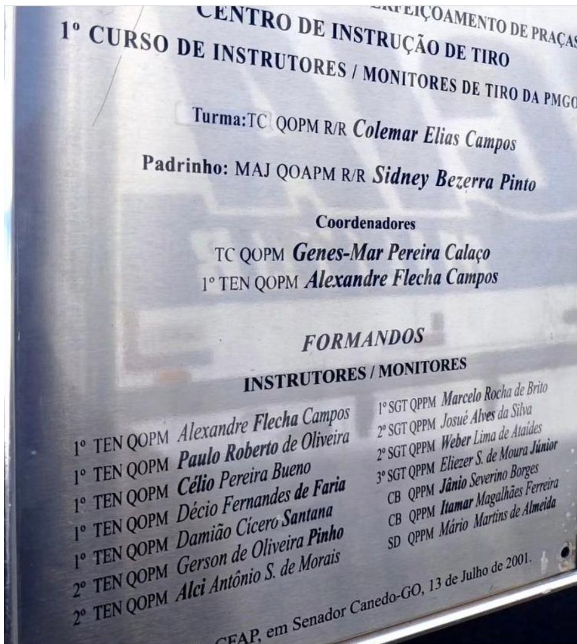
Figura 2 – 1ª Turma de Instrutores de Tiro da PMGO.

A seguir uma foto da plaqueta do 1º curso de instrutores de tiro da PMGO, a plaqueta encontra-se nas dependências do CIT no interior da CAPM: