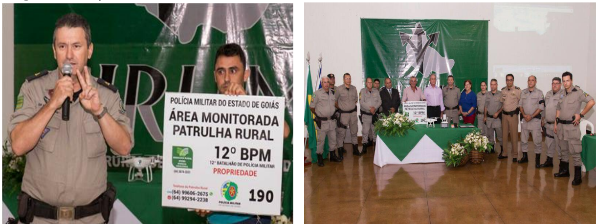
Imagem 01: Lançamento do Patrulhamento Rural Georreferenciado em Montes Claros – GO.

Modelo de placa conforme o POP 213 – Policiamento Rural, em lançamento do Projeto Patrulhamento Rural Georreferenciado na cidade de Montes Claros de Goiás, no dia 18/04/2016, em reunião na Câmara municipal de vereadores com a presença de varias autoridades civis e militares. Convém ressaltar que a confecção destas placas fica sob a responsabilidade dos proprietários rurais em convênios com seus respectivos sindicatos rurais. A Policia Militar propicia os dados cadastrados, logomarcas e as dimensões estabelecidas, observando que a referida placa deve ser afixada em local visível e estratégico na propriedade rural assistida pelo georreferenciamento.