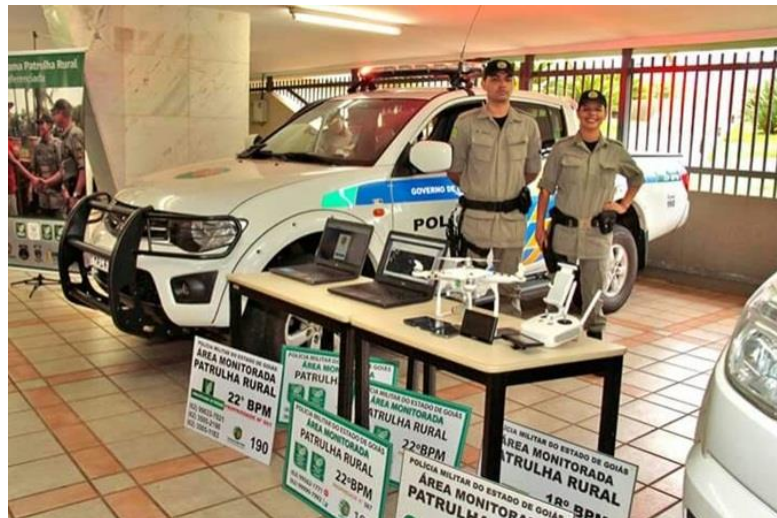
Imagem: Equipamentos do Gerorreferenciamento

Quanto aos equipamentos e armamentos de uso individual serão utilizados os que estão previstos no procedimento operacional padrão, coletes balísticos, Pistola ponto 40 ou Metralhadora MT 40, lanterna blindada de médio porte, corda multifilamento trançada em material polipropileno que evita a corrosão e proporciona segurança nas ações.