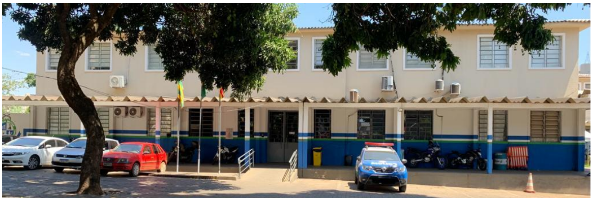
Figura 7 – Imagem da fachada do batalhão