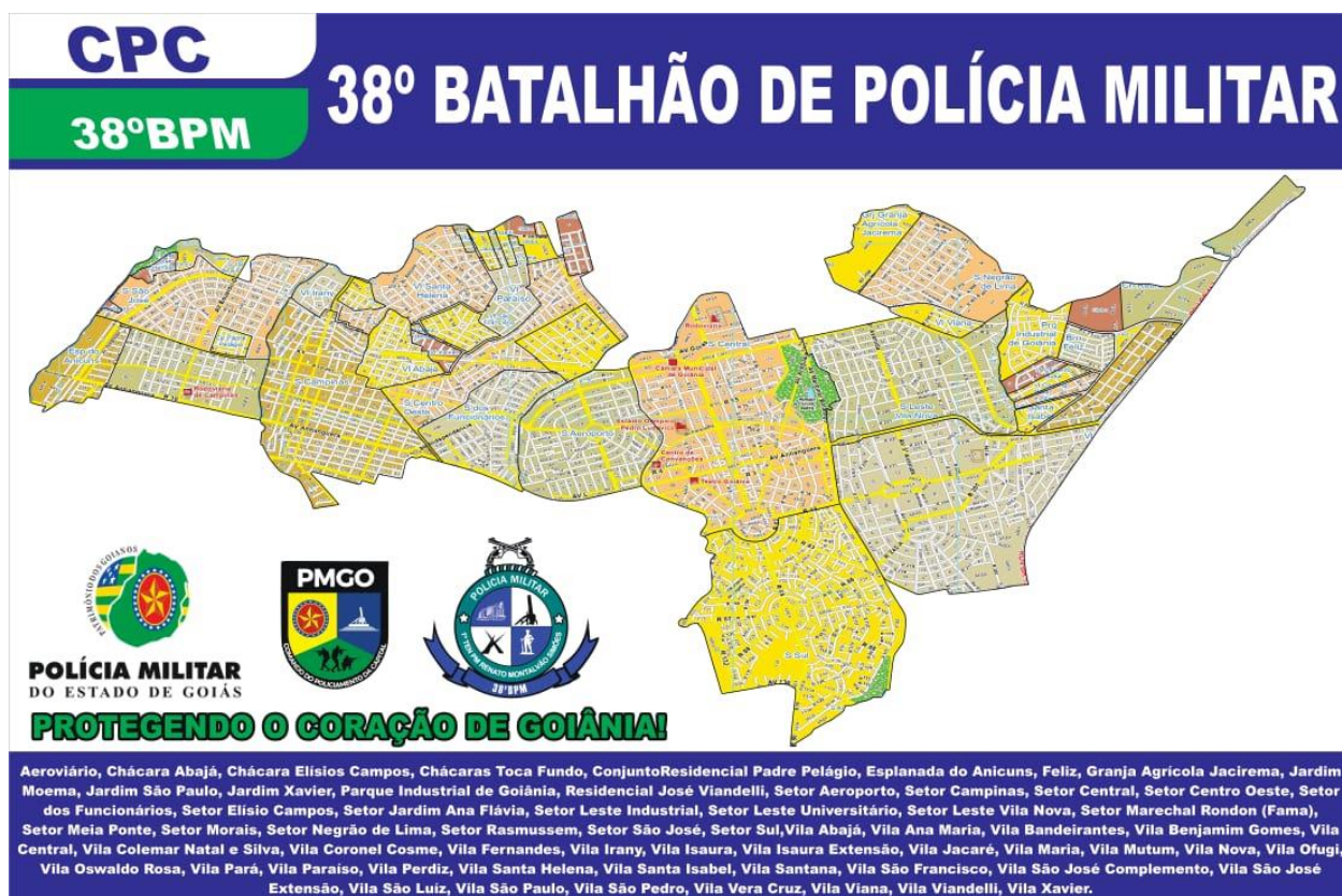
Figura 5 – Mapa de toda a área de atuação do 38º BPM da PMGO