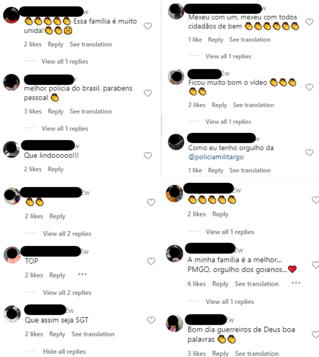
Figura 6 – Comentários – Publicação 3 (Instagram - PMGO - 24/02/2024)