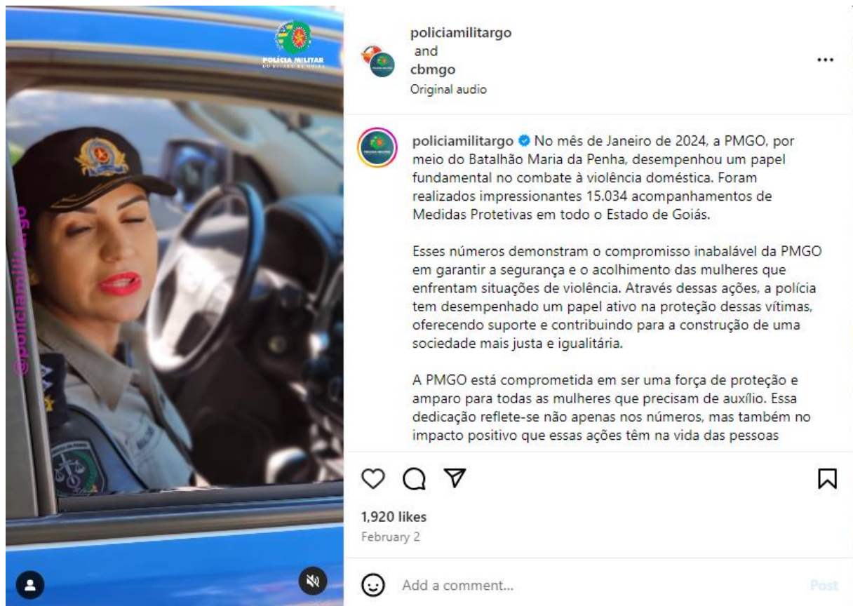
Figura 2 – Batalhão Maria da Penha – Publicação 2 (Instagram - PMGO - 24/02/2024)