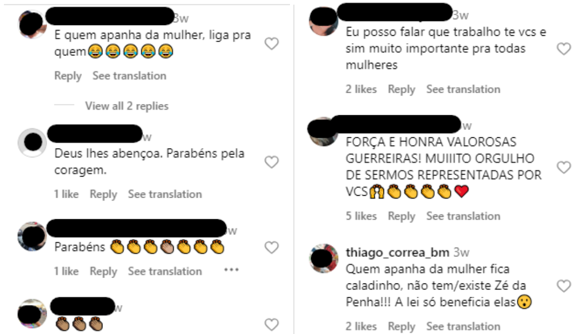
Figura 4 – Comentários a Publicação 2 (Instagram - PMGO - 24/02/2024)