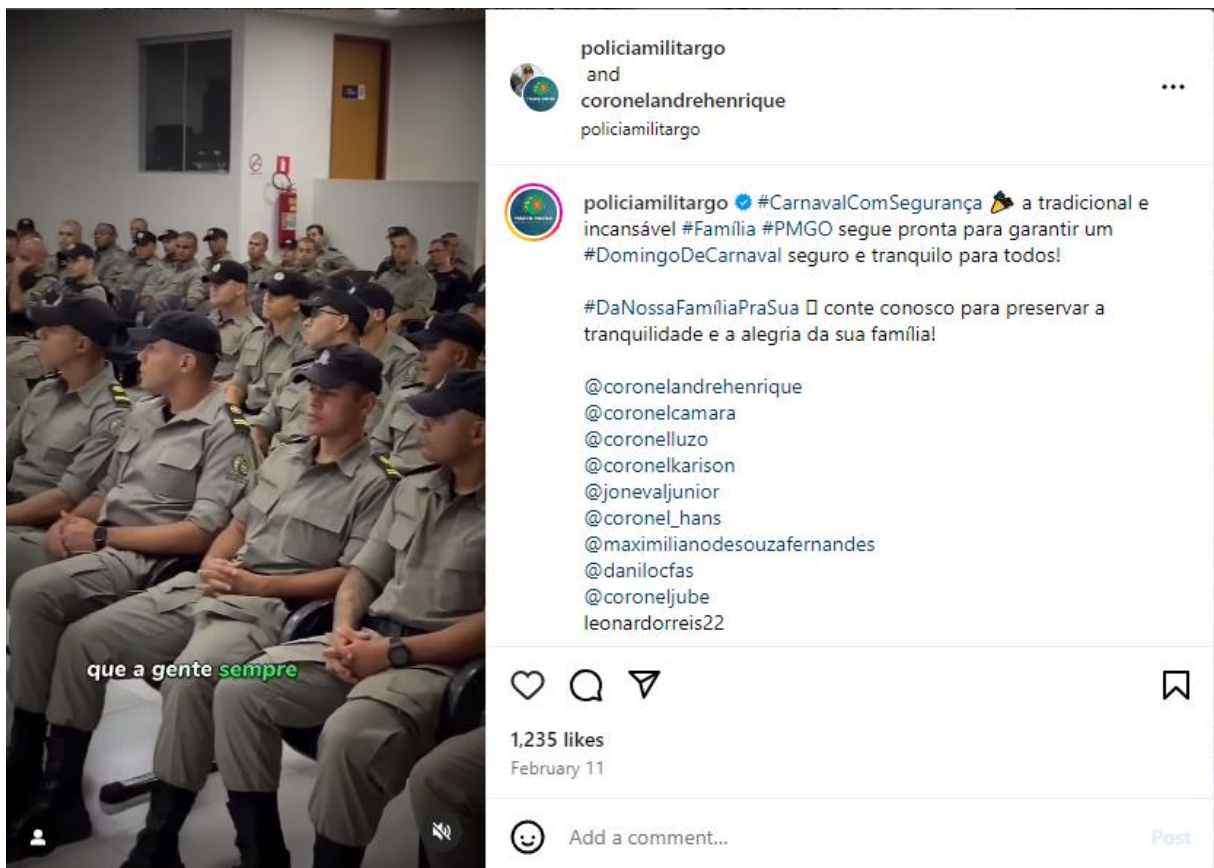
Figura 5 – Carnaval com Segurança – Publicação 3 (Instagram - PMGO - 24/02/2024)