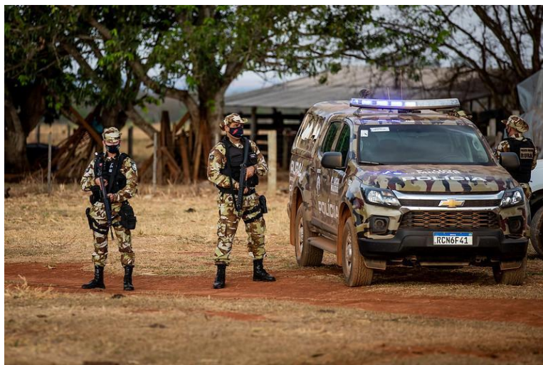
BATALHÃO RURAL DE GEOREFERENCIAMENTO PMMT