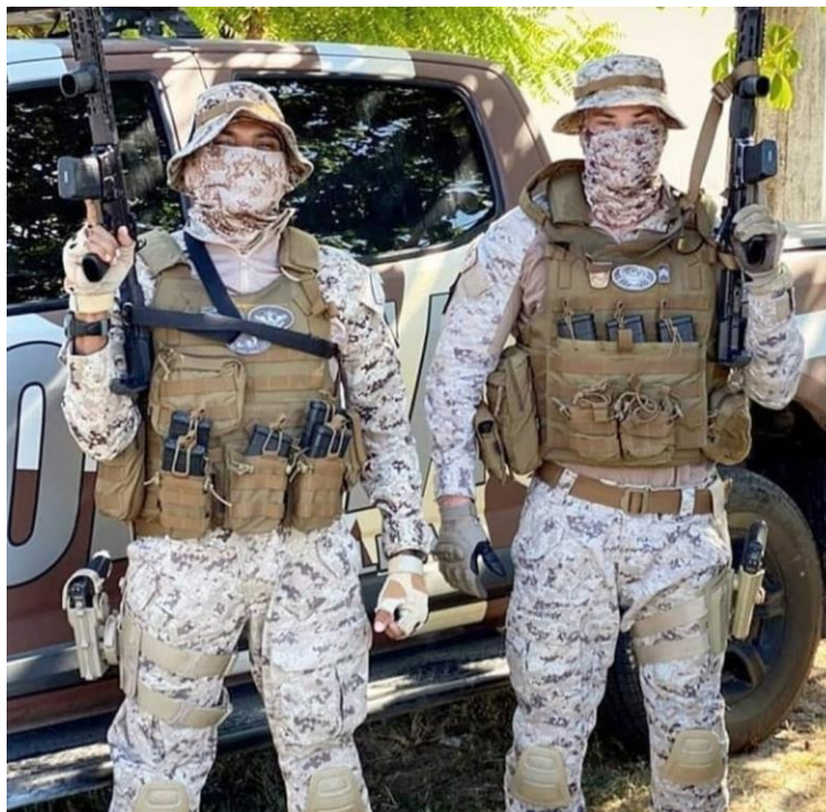
COTAR – PMCE