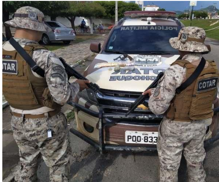
COTAR – PMCE