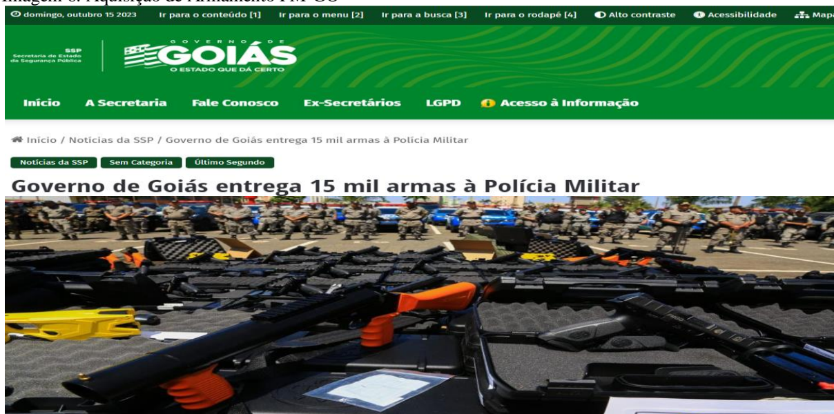
Imagem 6: Aquisição de Armamento PM-GO