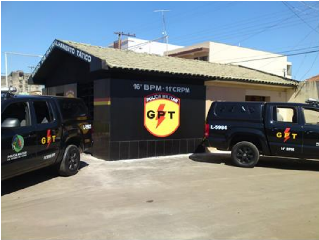
Figura 6 - Antiga base de apoio GPT