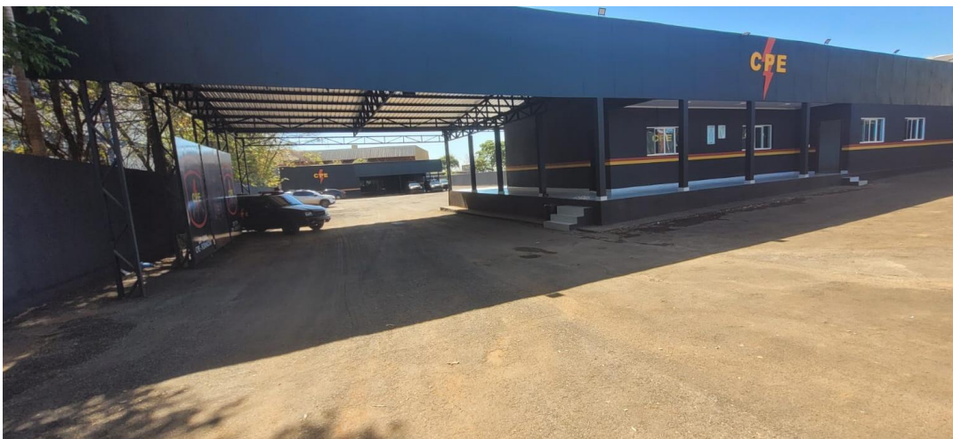
Figura 4 – Base atual da 20ª CIPM

(...) na época do GOE por ser efetivo pouco, era dentro dos quartéis, separava um quarto onde guardava as armas do GOE e teve uma razoável melhora no GPT. A 20cipm tem uma estrutura excelente, há apoio de empresários hoje em dia (Entrevistado 2).