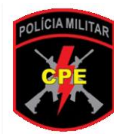
Figura 3 – Brasão da 20ª CIPM