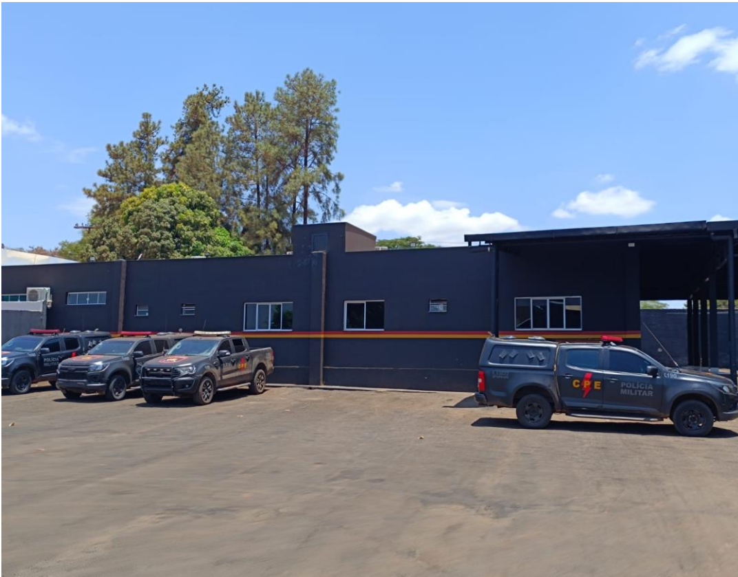
Figura 5 – Base atual da 20ª CIPM