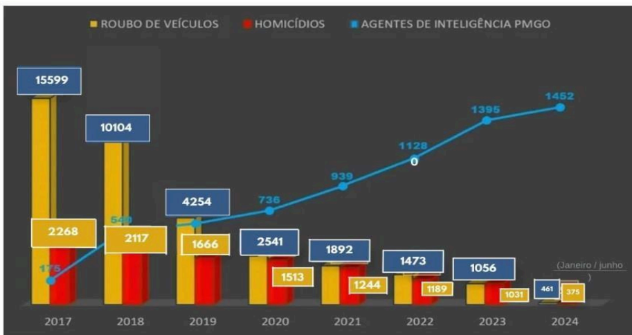
FIGURA 04: AGENTES DE INTELIGÊNCIA E RESULTADOS