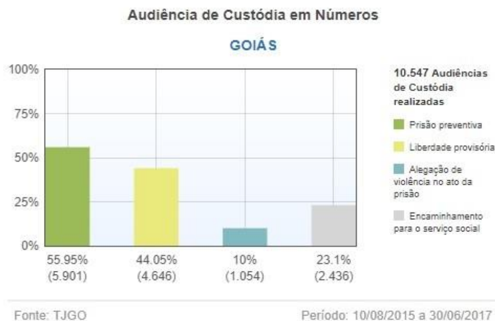
Figura 3 - Audiências de custódia em âmbito estadual