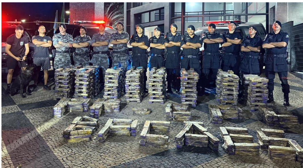
Imagem 1: Ação conjunta com emprego de cães para localização de entorpecentes