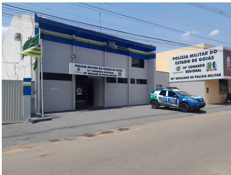
Figura 1 – Fachada do 40º Batalhão de Polícia Militar em outubro de 2023