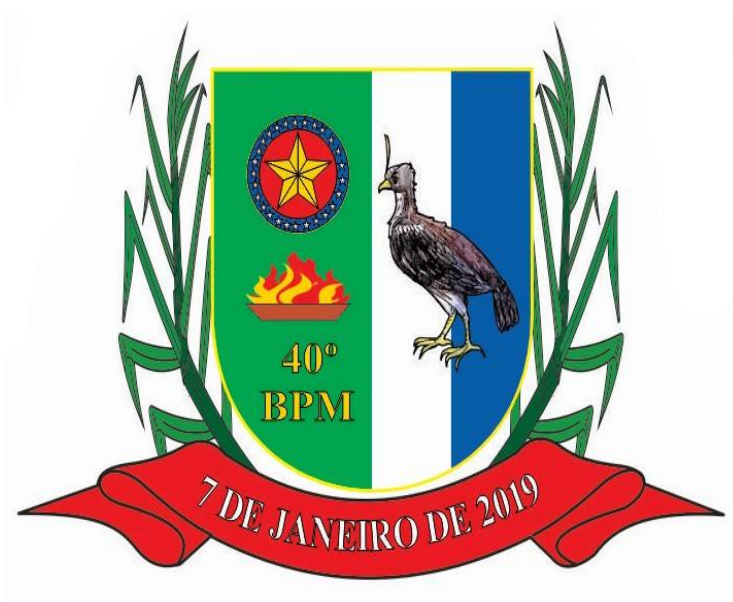
Figura 2 – Brasão do 40º Batalhão de Polícia Militar

O 40º Batalhão de Polícia Militar integra a circunscrição do 16º CRPM (Comando Regional de Polícia Militar), com sede no município de Trindade, sendo criado pela Portaria nº 11.452/2018 PM de 04 de janeiro de 2019 e publicado no Diário Oficial Eletrônico PM nº 4/2019.