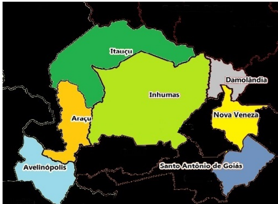
Figura 3 – Área de atuação do 40º BPM